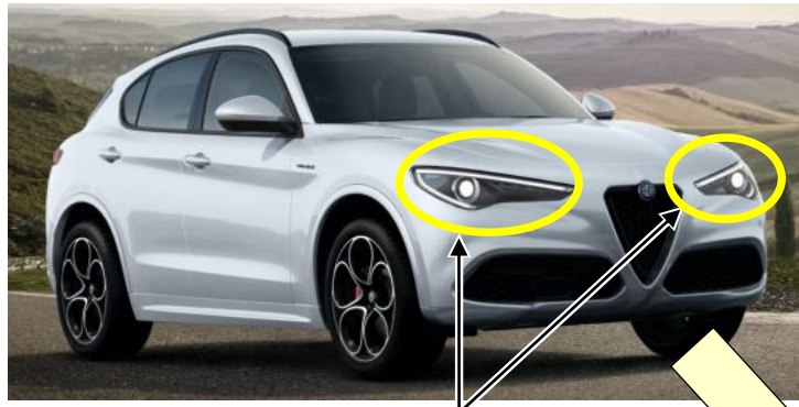
アダプティブヘッドライト