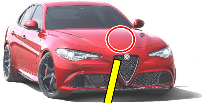
ブレーキ・システム・モジュール