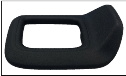
基準不適合発生箇所