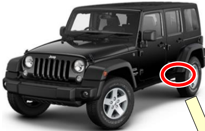
アンダーボディアダーレール